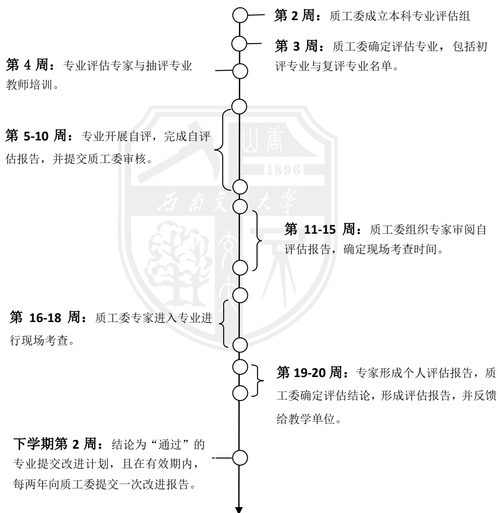
图 1 西南交通大学本科专业评估工作流程

根据学校教学质量保障体系相关工作的总体部署，由质工委委员牵头，从专家库中抽取一定数量的专家，组成专业评估组，对全校本科专业进行评估。教学单位负责组织专业接受校级评估，将校级评估结果反馈给专业，组织专业持续改进。专业评估每学期进行一次，采用自愿申报、随机抽样和学校指定相结合的办法确定每学期评估的专业，原则上全校所有专业 6 年内必须进行一轮本科专业评估。本科专业评估工作流程如下：